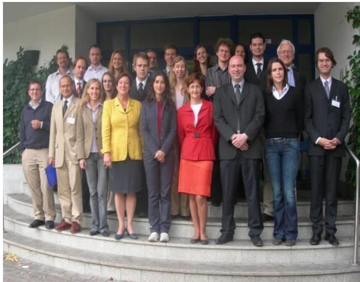
Groepsfoto Sommerkurs 2007